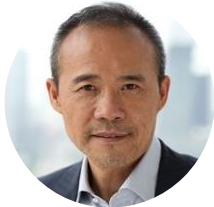
王石 万科 创始人