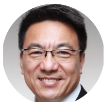
曲宏斌 汇丰银行 大中华区首席经济学家