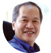
关明生 阿里巴巴 前COO