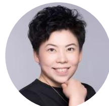
邓亚萍 奥林匹克冠军